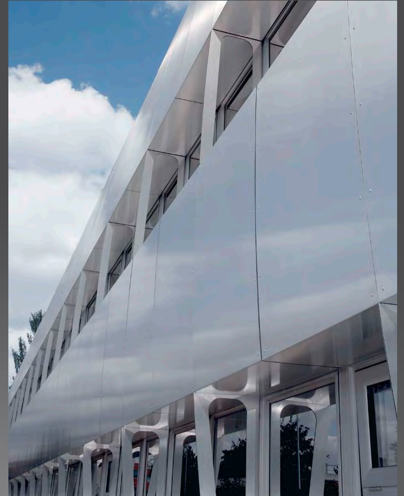
Bull Massy, France | Architect: Axel Schönert | Material: naturAL brushed