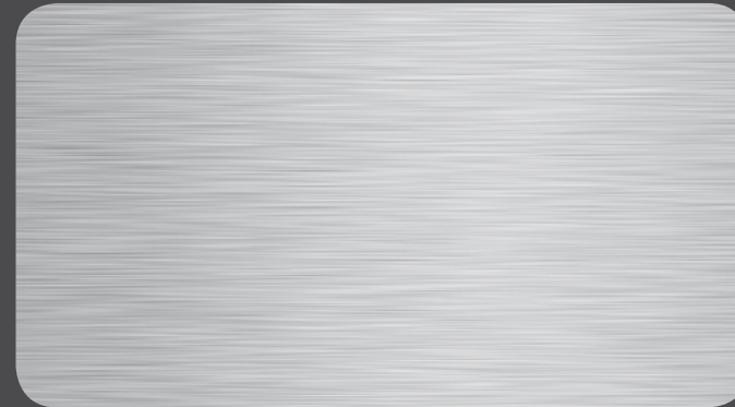
naturAL BRUSHED | 400

Auch im Hinblick auf Umweltfreundlichkeit ist der Name Programm: ALUCOBOND® ist „natürlich“ vollständig recycelbar.