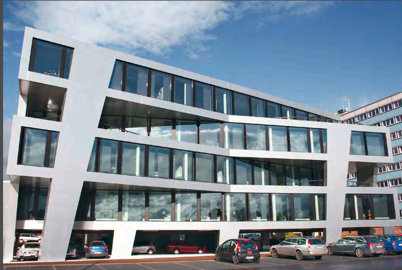
Göpel Electronic, Germany | Architect: Wurm + Wurm Architekten Ingenieure GmbH | Material: naturAL brushed