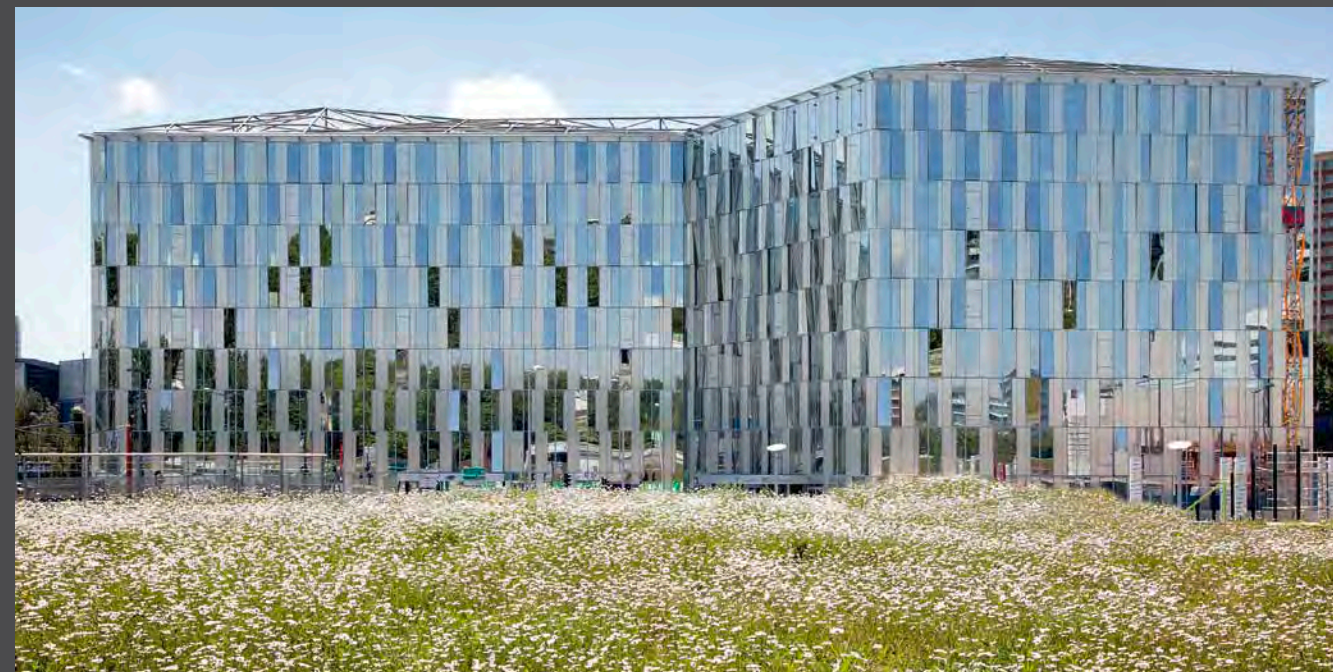
Onix, Lille, France | Architect: Dominique Perrault Architecture | Material: naturAL line